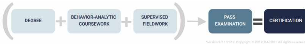
<그림 2> BACB 행동분석전문가 교육과정